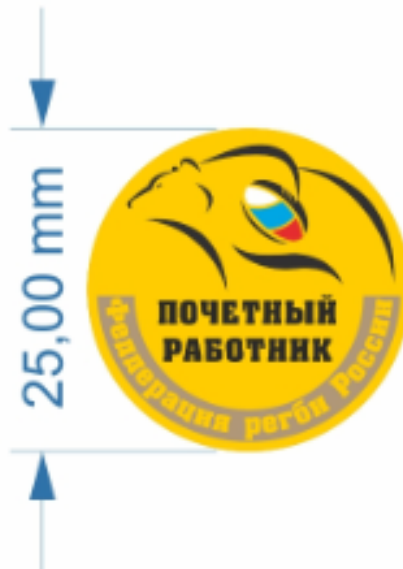
Рисунок Почетного знака Федерации регби «Почетный работник Федерации регби России»

Почетный знак Федерации регби имеет приспособление на оборотной стороне для крепления к одежде.